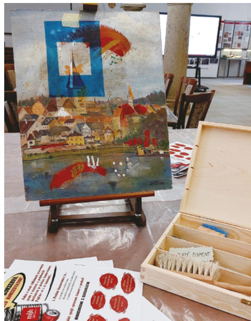
Edukační program Nebuď konzerva, buď konzervátor zahrnuje nejenom odborné čištění obrazů, ale i zašlých mincí