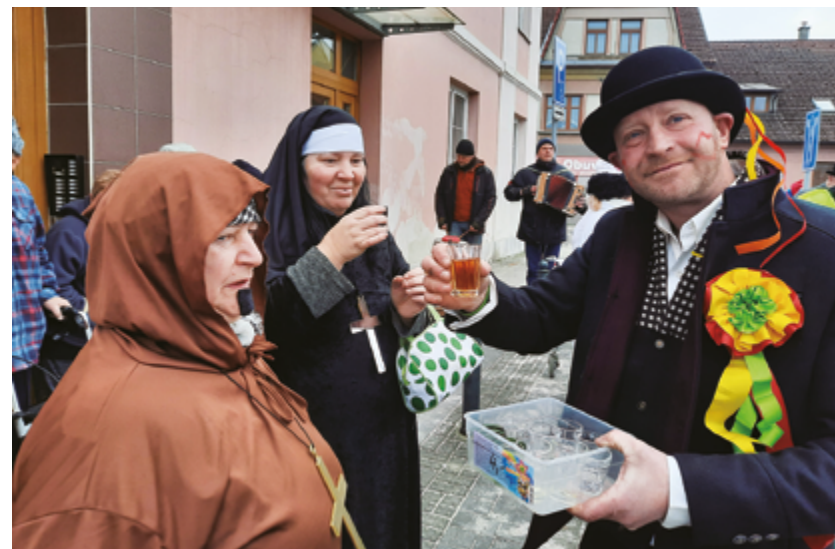
Terénní výzkum masopustní obchůzky v Lomnici nad Lužnicí

Významným vědeckým úkolem byla spolupráce na celostátním vědecko-výzkumném úkolu v rámci projektu NAKI Prezentační strategie pro muzea a sbírky. Metodika přípravy a realizace muzejních výstavních projektů Národního zemědělského muzea v Praze, který byl zpracováván