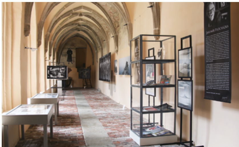
Výstava Memento mori v křížové chodbě minoritského kláštera