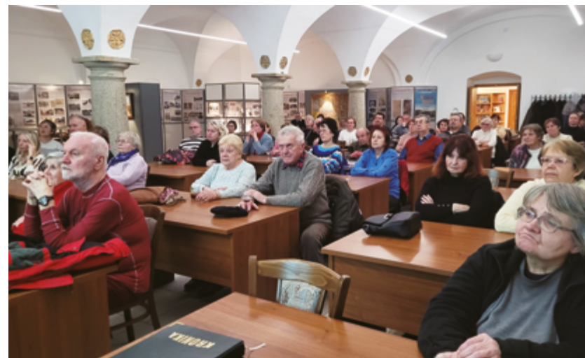
Členové spolku při přednášce v konferenčním sále muzea

Podobně pozitivní ohlas mělo také červnové setkání členů spolku, které mělo netradiční formu v podobě návštěvy unikátního hudebně divadelního představení Loutna česká Adama Václava Michny z Otradovic přímo