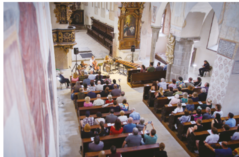
Koncert Nová hudba v kostele sv. Jana Křtitele

24. 6. Chvála zpěvu , koncert v podání dětských pěveckých sborů Nova Domus a Novadomáček kostel sv. Jana Křtitele.