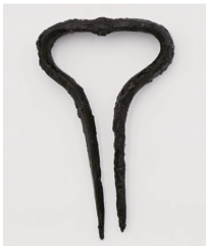
Brumle z fondu Archeologie po konzervátorském zásahu spočívajícím ve stabilizaci korozních produktů tanátovacím roztokem a následnou konzervací voskem Revax 30

V roce 2025 byla navíc provedena konzervace dřevěného malovaného trámu ze sbírky Městského muzea a galerie Dačice, pocházejícího pravděpodobně ze 16. století z měšťanského domu č. p. 4. Tento předmět je nyní součástí nové expozice dačického muzea.