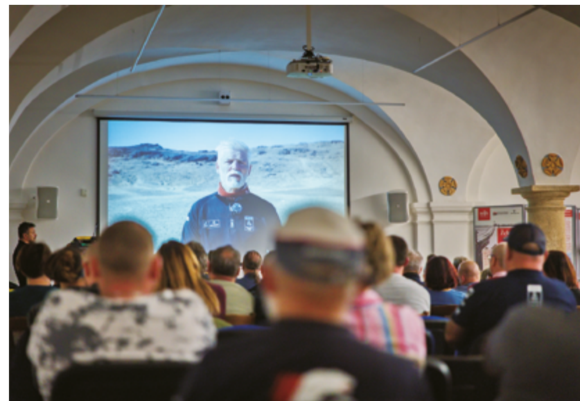
Přednáška Takový je Dakar