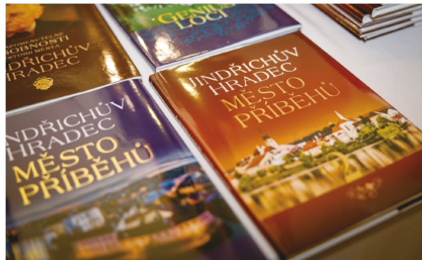
Publikace Jindřichův Hradec – Město příběhů 2