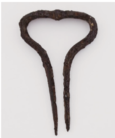
Brumle z fondu Archeologie před konzervátorským zásahem