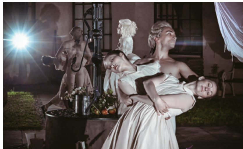
Imerzivní divadelní inscenace Loutna česká