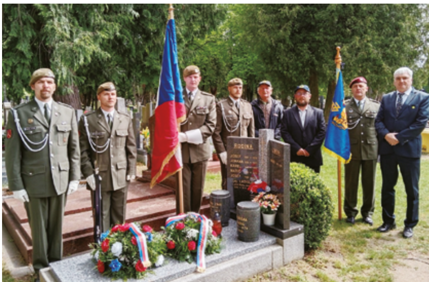
Piетní akt 8. května 2025 na městském hřbitově v Jindřichově Hradci u hrobu čs. válečného letce plukovníka Rudolfa Zimy, rodáka z města nad Vajgarem, účastníka bitvy o Francii a bitvy o Británii

bojištích 2. světové války pro televizní pořad Prima Česko. Celoročně pracuje v sedmičlenném Výboru Českého svazu letectví, se kterým organizuje některé celorepublikové aviačické akce, pro členy Svazu rovněž pravidelně připravuje tematické přednášky.