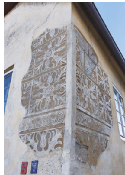
Spolek se v roce 2025 podílel na záchraně fyzicky ohrožené nárožní sgrafitové výzdoby domu v ulici Nové stavení v Jindřichově Hradci.

Ke konci roku 2025 měl Spolek přátel starého Jindřichova Hradce celkem 155 aktivních členů.