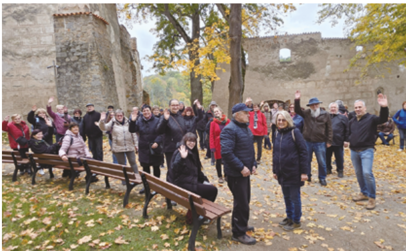
Podzimní zájezd spolku do kraje Toulavy – členové spolku na nádvoří královského hradu Zvíkov

samosprávy. Zdánlivě nenápadná památka má nedocenitelnou hodnotu, neboť v Jindřichově Hradci ani okolí se nevyskytují podobná renesanční sgrafita, navíc dochovaná unikátně ve dvou výtvarně a časově odlišných vrstvách.