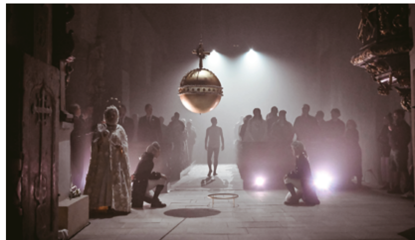
Imerzivní divadelní inscenace Loutna česká

Neméně důležitá byla spolupráce s místními a regionálními televizemi, zejména s Jindřichohradeckou televizí, Jihočeskou televizí, Českou televizí, TV Nova, TV Prima či Praha TV. Televizní reportáže a pozvánky umožnily oslovit širší publikum a vizuálně atraktivní formou prezentovat činnost muzea. Významnou roli sehrály také specializované webové portály zaměřené nejen na cestovní ruch a kulturu, například Seznam.cz , Kudy z nudy , AMG , Budějcká drbna , Výletník a další.