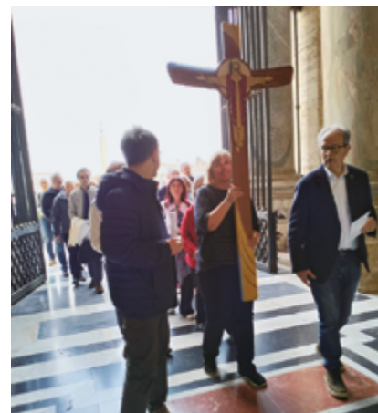
Předsedkyně Jihočeské pobočky vstupuje do vatikánské baziliky sv. Petra a Pavla

Zasedání Světového betlemářského sdružení přineslo jednu mimořádnou záležitost, a to možnost stát se součástí celosvětové aktivity pořádané vatikánským Dikastériem pro evangelizaci v Jubilejním Svatém roce 2025. Jednalo se o pouť, kdy stovky věřících absolvují cestu s jubilejním dřevěným křížem se začátkem na novém náměstí Piazza Pia nedaleko Andělského hradu, odkud se v modlitbě přesouvají