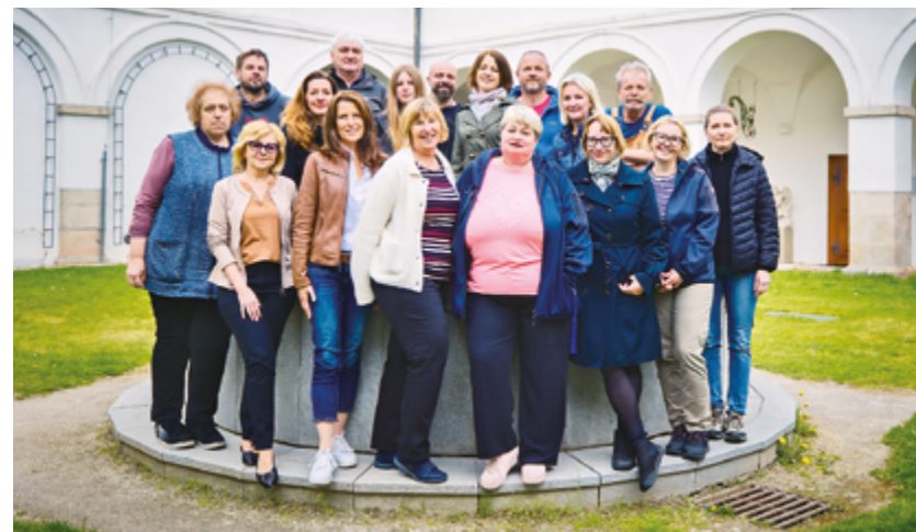
Kolektiv zaměstnanců muzea