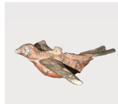
Vlaštovka z modelu hamru, kterou bylo potřeba znovu umístit do modelu jako jeden z pohyblivých prvků

si mohou žáci sami vyzkoušet čištění obrazů a mincí. V říjnu se muzeum zúčastnilo mezinárodní akce Evropské dny konzervování-restaurování a uspořádalo dny otevřených dveří. Návštěvníci se tak mohli přihlásit na vybrané termíny a nahlédnout do konzervátorské dílny, seznámit se s postupy a materiály používanými pro ošetřování historických předmětů a poslechnout si přednášky kurátorů ve vybraných depozitářích.