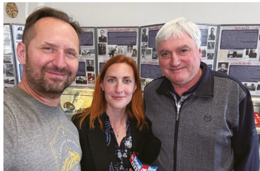
Po natáčení reportáže pro pořad Prima Česko v konferenčním sále Muzea Jindřichohradecka v květnu 2025

Jako historik spolupracuje s AV studiem Jindřichův Hradec na zpracování textových podkladů pro historické filmové dokumenty z našeho