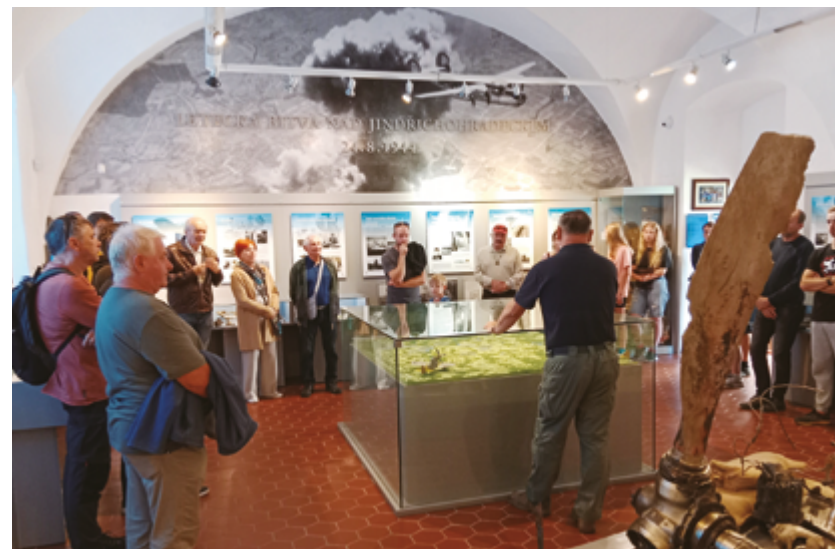
Komentovaná prohlídka expozice Letecká bitva nad Jindřichohradeckem u příležitosti 81. výročí bitvy

Uplynulý rok lze považovat z pohledu činnosti Klubu historie letectví za velice úspěšný. To dokládá více než dvacet pět akcí, které si připravil pro veřejnost samostatně či ve spolupráci s jinými institucemi. V roce 2025 oslavil klub 35 let od svého založení v červenci 1990. Klub je autorem expozic Leteckého muzea Deštná, v této samostatné zájmové organizaci pracuje patnáct členů. Pět z nich je členy Českého svazu letectví.