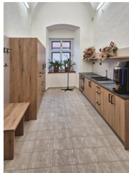
Rekonstrukcí původního provozního skladu vzniklo nové zázemí s kuchyňkou a odpočinkovým koutem pro návštěvníky i zaměstnance

Náklady z dlouhodobého majetku (558) činily 1 460 506,37 Kč. Byly pořízeny nové židle do konferenčního sálu a kuchyňská linka do edukační místnosti.