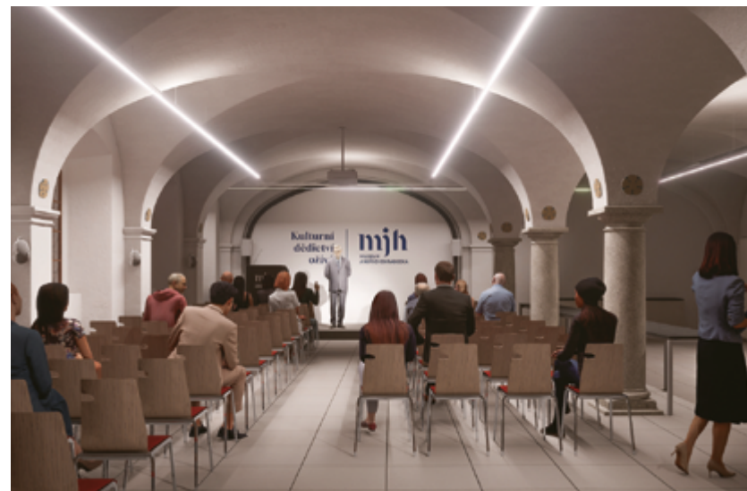
Vizualizace nové podoby konferenčního sálu

Ráda bych na tomto místě poděkovala našemu zřizovateli, Jihočeskému kraji, a Městu Jindřichův Hradec, s nímž se snažíme dále rozvíjet a prohlubovat spolupráci, všem kolegům a zaměstnancům muzea, kteří svou prací a nasazením přispívají k jeho úspěšnému fungování a rozvoji, dárcům a sponzorům, odborným spolupracovníkům i partnerům a všem, kteří se podílejí na tom, že kulturní dědictví skutečně ožívá.