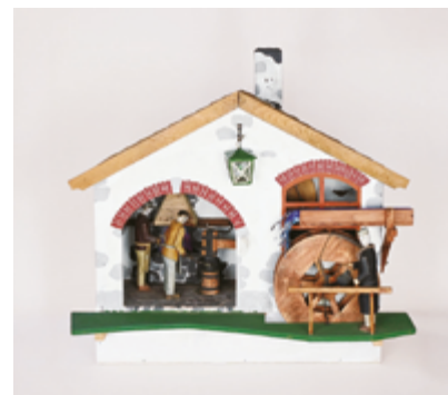
Model hamru z vitríny Muzea Jindřichohradecka v Panské ulici po konzervátorském zásahu

Zcela nově byl realizován edukační program zaměřený na práci konzervátora a restaurátora Nebud' konzerva, bud' konzervátor! V jeho rámci konzervátorka představuje žákům konzervátorskou dílnu muzea a poté