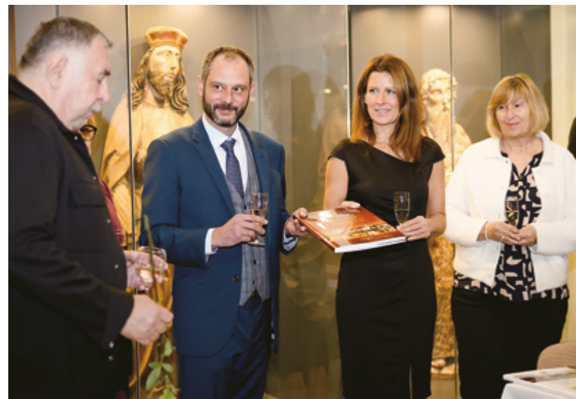
Křest knihy Jindřichův Hradec – Město příběhů 2

Muzeum se v uplynulém roce podílelo na vydání několika odborných publikací. Významnou roli sehrálo při přípravě druhého dílu knihy Petra